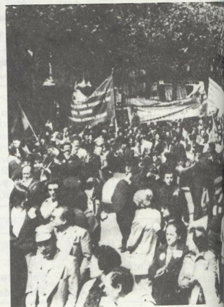
Barcelona, más de doscientos mil trabajadores, del Paseo de Gracia a la carretera de Valencia.

Nicolás Redondo, pronunció el discurso final. Reafirmó el carácter de sindicato de clase de UGT y aludió a la gravedad de la crisis que no es sólo de gobierno, sino de Estado. Señaló la necesidad de reflexión sobre puntos concretos de unidad y de elaborar un plan común ante las elecciones sindicales.