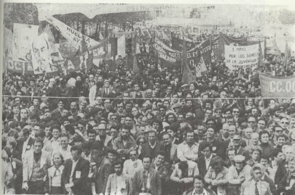
"Contra el paro", la gran reivindicación del 1.º de Mayo unitario.