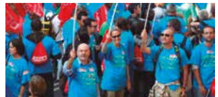
Manifestación en contra de la LOMCE. Madrid, 2012