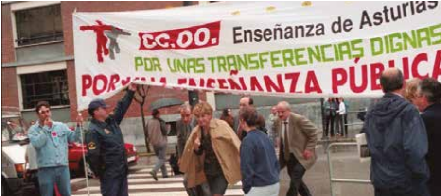
La ministra de Educación, Esperanza Aguirre, tiene que pasar bajo una pancarta de CCOO en su visita a Gijón