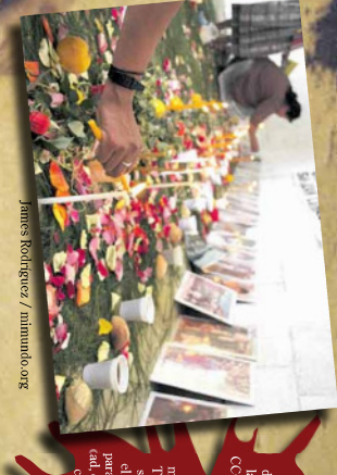
Janiss Rodriguez / iammundo.org