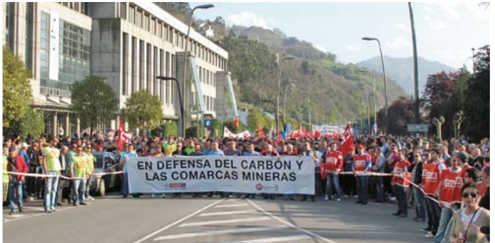
30.000 personas en defensa de la minería. Miercoles 17 de abril.

No hay tregua para el carbón. El sector es víctima de numerosos ataques desde distintos frentes que ponen peligro el futuro de miles de familias. La Federación de Industria de CCOO de Asturias continúa asumiendo el compromiso de defender un sector clave para Asturias, mientras el Gobierno del PP fomenta la incertidumbre y la inestabilidad en la minería.