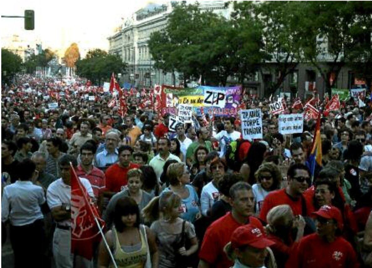
Manifestación el día de la Huelga General del 29 de septiembre de 2010.

Conviene recordar que CCOO junto con UGT, principales sindicatos convocantes de la huelga general del 29 de septiembre de 2010, utilizaron uno de los instrumentos que tienen reconocidos por nuestro orde-