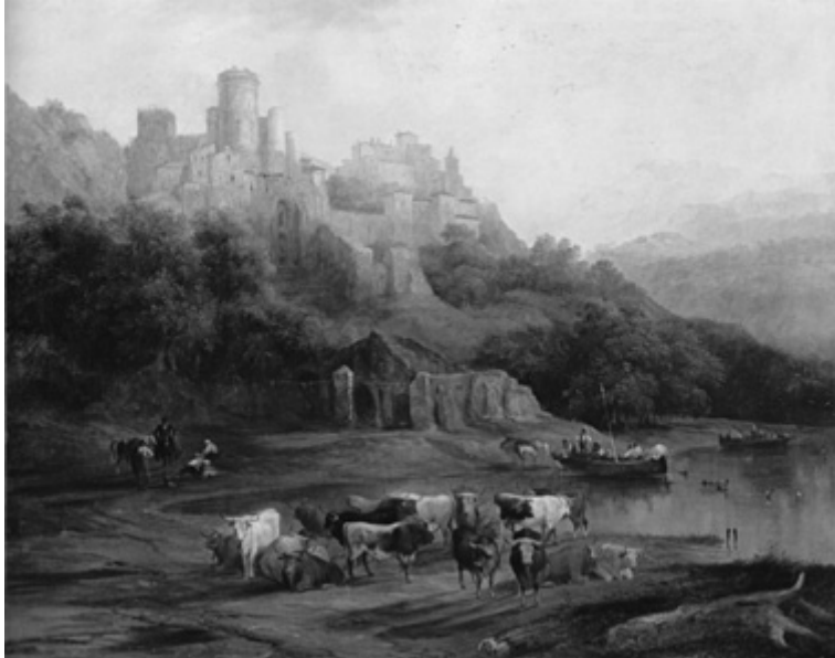
Manada de toros junto a un río, al pie de un castillo. J. P. Villaamil. Museo del Prado.

Lograr que los mercados se pongan al servicio del empleo es ante todo una responsabilidad de los gobiernos nacionales. A su disposición se encuentra un amplio abanico de medidas inspiradas en el Pacto mundial para el empleo de la OIT, que van desde programas de protección social que favorezcan el empleo, hasta regulaciones de salarios mínimos y empleo bien diseñadas, pasando por el diálogo social productivo. Para que se movilicen tales recursos es necesario que se establezca un marco macroeconómico y financiero que favorezca el empleo.