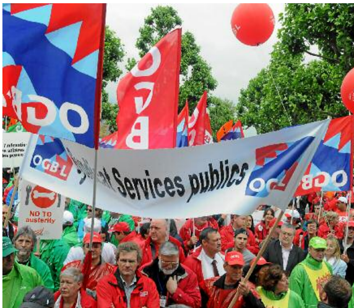
Manifestación de la CES contra las políticas de austeridad celebrada en Luxemburgo.

Hasta el momento solamente hemos visto el comienzo de la crisis social y política en Europa. En otras palabras, ahora es tiempo para que los sindicatos que estén pasados de moda, temerosos de nuevas alianzas, temerosos de perder el control, más o menos casados con partidos democráticos/socialistas y encerrados por una creencia sin límites en la asociación social, de volver a evaluar sus posiciones. La resistencia social a las políticas de austeridad está incrementando a lo largo de Europa, pero hay una carencia de coordinación y liderazgo europeo. Tenemos que apoyar a aquellos que luchan y seguir su ejemplo. Tenemos que pasar de la defensiva a la ofensiva, no solamente dirigiéndonos al poder, sino tomando el poder, si queremos detener el desarrollo actual hacia una Europa cada vez más autoritaria y antisocial. ■