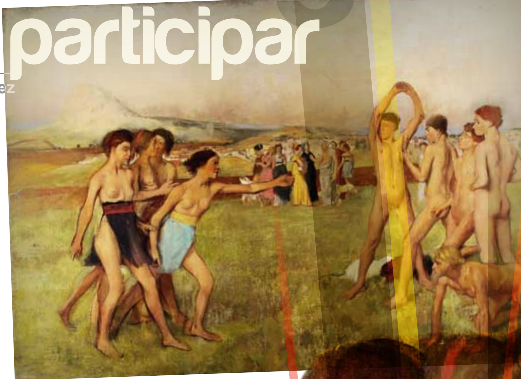
JÓVENES ESPARTANAS DESAFIANDO A SUS COMPAÑEROS (1860), DE DEGAS. HA PODIDO VERSE RECIENTEMENTE EN MADRID EN LA EXPOSICIÓN COLECTIVA HEROÍNAS (MUSEO THYSSEN-BORNEMIZSA Y FUNDACIÓN CAJA MADRID).

Por ello, parece pertinente investigar si el ejercicio del poder, tal y como está