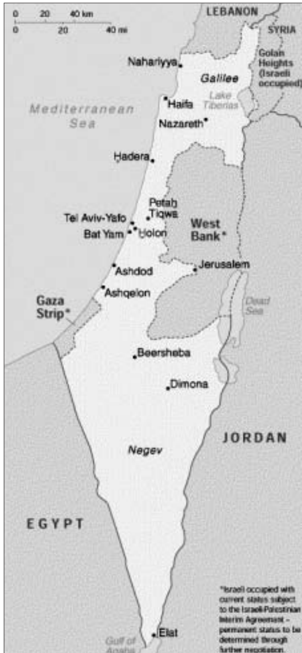
Mapa 1: Israel y los Territorios Palestinos ocupados: Cisjordania (West Bank) y Gaza